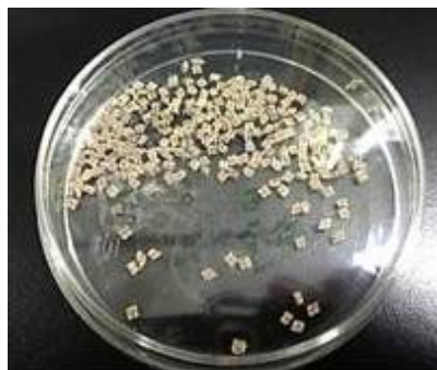
図1. 固定化菌体(乾燥後)