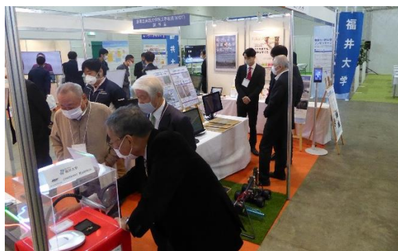
(福井大学展示ブースの様子)

今後も産学官連携本部では、社会や技術交流活動、それらの発信を積極的に行っていきます。