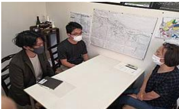
(試作品づくりに関する進捗報告)