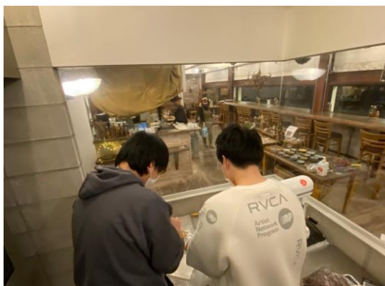
(ASUWAYAMA DECK での活動の様子)

FAA*学ぶならふくい！応援事業の補助を受け、福井県産純米大吟醸酒「福の愉」プロジェクトの一環として、令和2年度起業化経営論のアイデアチャンピオンのチームメンバーであり、経営・技術革新工学研究室「竹本研究室」の学生が中心となって、吉田酒造有限会社提供の酒粕を用いた「ショコラテ」、「スコーン」、「クッキー」が『ASUWAYAMA DECK』にて2月12日（金）から3月31日（水）まで期間限定で販売されます。これまでの販売に至る活動として、試作品製作の計画および商品化に向けた戦略や試作品づくりやティスティングを重ねていき、またアルコール濃度の分析など、研究教育実践活動を行っています。本プロジェクトは様々な展開も視野に入れており、今後の活動が期待されます。