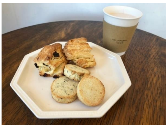
(酒粕ショコラテ、スコーンなど試作品)

*FAA とは、ふくいアカデミックアライアンスの略称。本組織は福井県内すべての大学、短期大学、高等専門学校が参画する新たな協議体。連携の強化や地域の活性化を目的に令和元年に設立。