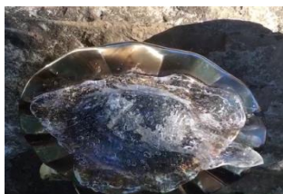
炭をスライムで覆って密閉