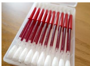
2017年度 シミ落とし綿棒セット